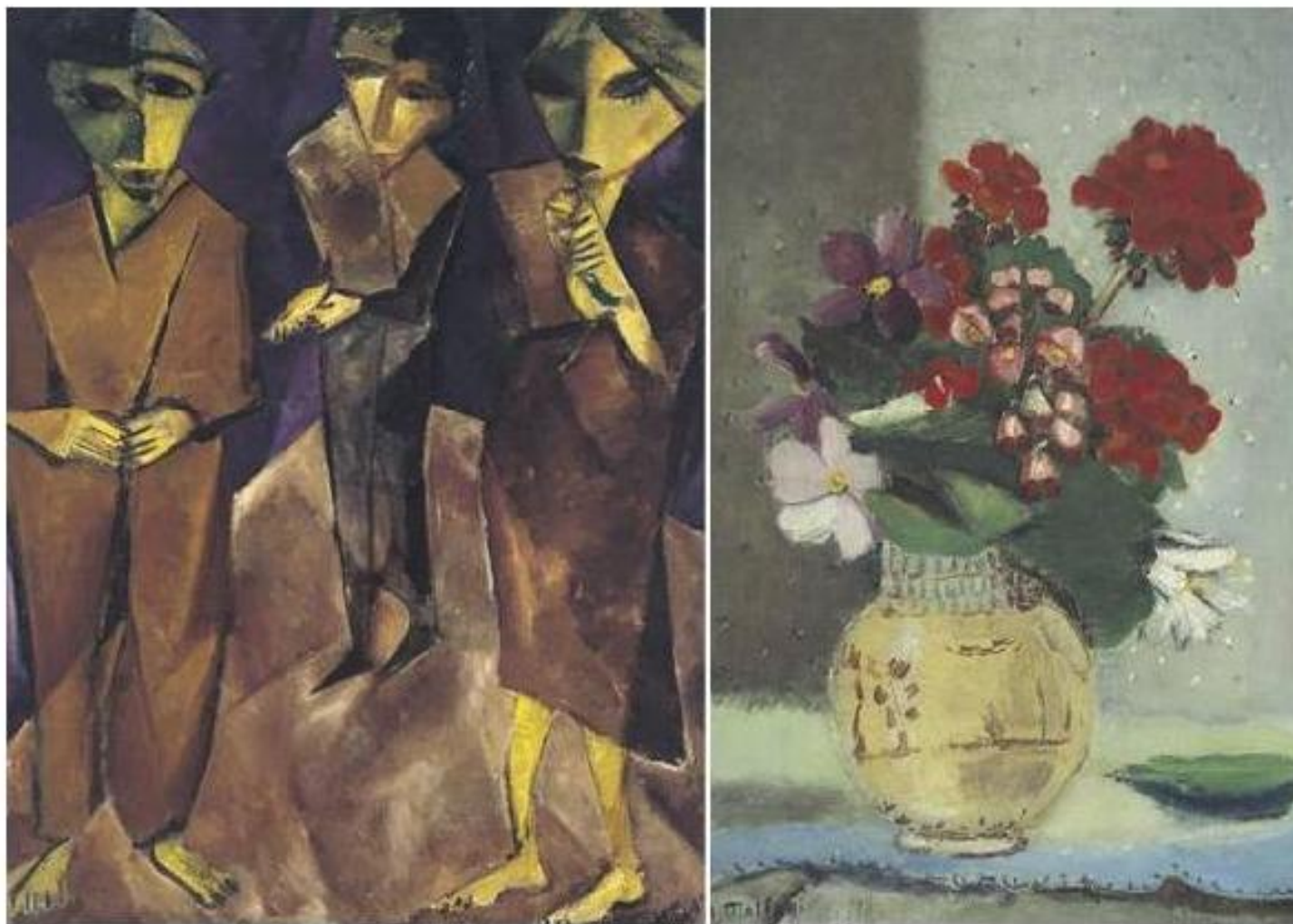
Quadros de Lasar Segall e Annita Malfatti estão entre as 28 obras de 17 artistas que ficarão expostas no espaço até 29 de janeiro de 2010. O Espaço Cultura BMFBOVESPA fica na Praça Antonio Prado, 48, próximo à estação São Bento do metrô.

Acervo de arte reunido por Roberto Marinho ganha mostra em São Paulo Exposição reúne quadros de Portinari, Tarsila e Annita Malfatti. Evento gratuito se estende até janeiro de 2010